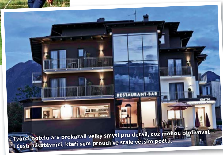
Tvůrci hotelu arx prokázali velký smysl pro detail, což mohou obdivovat i čeští návštěvníci, kteří sem proudí ve stále větším počtu.

„To není jen tak, je potřeba stále vyvíjet veškerou snahu, aby příroda zůstala zachována ve své původní podobě,“